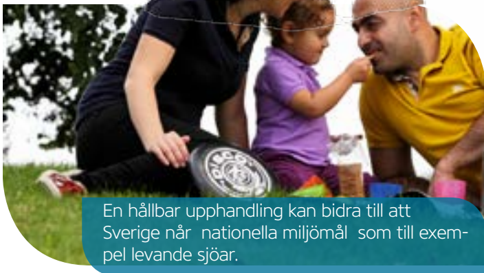
En hållbar upphandling kan bidra till att Sverige når nationella miljömål som till exempel levande sjöar.

Vi rekommenderar att man väljer att kräva märkning såsom ett tilldelningskriterium/börkrav om den upphandlande myndigheten ännu inte har klart för sig hur marknadstillgången på miljömärkta produkter ser ut. Genom att använda miljömärkning som del av anbudsutvärderingen avvägs önskan om miljöhänsyn mot andra faktorer,